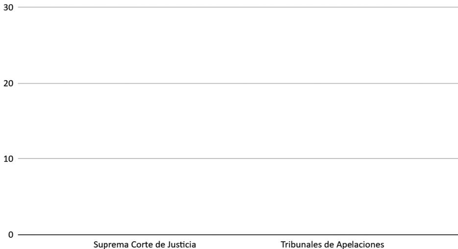
Gráfico 2: Referencia a la temática