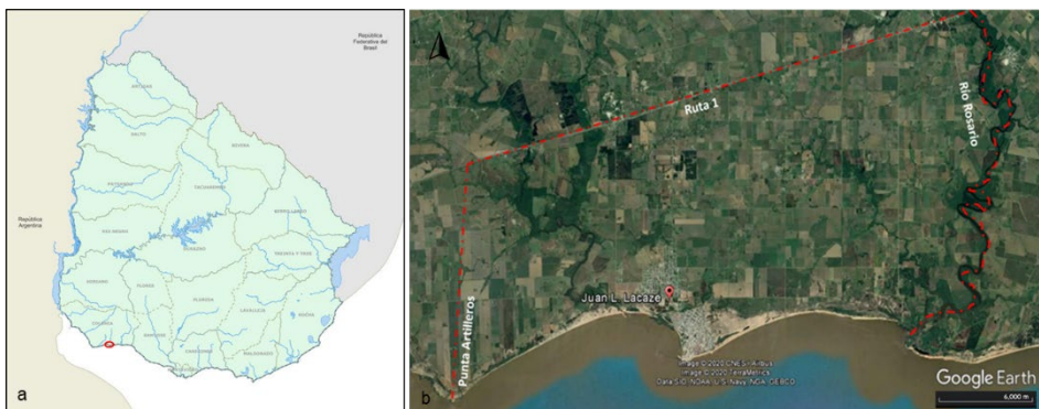
Figura 1. a) Localización del municipio de Juan Lacaze, en el departamento de Colonia, Uruguay (tomado y modificado de Ministerio de Transporte y Obras Públicas [MTO, s.f.]). b) Alcance territorial del Inventario del patrimonio cultural material de Juan Lacaze y alrededores (tomado y modificado de Google, s.f.).

El alcance territorial del Inventario tiene un radio de unos 10 km en torno a la ciudad de Juan Lacaze, departamento de Colonia (figura 1). Sus límites corresponden a la punta Artilleros (al oeste), la Ruta 1 (al norte), la margen izquierda del río Rosario (al este) y el Río de la Plata (al sur). El área coincide aproximadamente con el Municipio de Juan Lacaze, creado en 2010 (ley 18.653), cuya superficie es de 107 km 2 y su población unos 13.500 habitantes (Instituto Nacional de Estadística [INE], 2011).