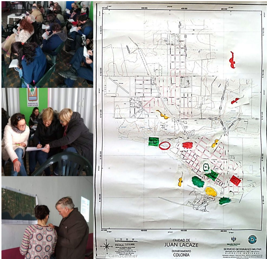
Figura 3. Izquierda: Imágenes del trabajo individual y colectivo desarrollado en el primer taller. Fotografías: equipo ACCS (se cuenta con el permiso expreso del uso de imagen de quienes aparecen en las fotografías). Derecha: Ejemplo de mapa colaborativo sobre el grado de riesgo, elaborado por uno de los equipos durante el segundo taller. Referencias del mapa: guitarra (patrimonio artístico), nube (patrimonio inmaterial), torta frita (patrimonio gastronómico), diseño decorativo (patrimonio arqueológico indígena). En verde, amarillo y rojo, los grados de riesgo identificados para cada bien patrimonial.

tivos por los cuales consideraban ese elemento como parte del patrimonio lacazino. Además, los equipos trabajaron en torno a las acciones necesarias para conservar y proteger y las oportunidades para valorizar el elemento patrimonial escogido.