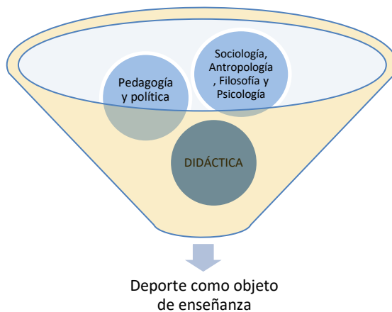
Figura 1. La construcción epistémica del objeto deporte (elaboración propia).

El saber del deporte, entonces, deberá nutrirse de los saberes de las ciencias sociales —filosofía, sociología, antropología y psicología—, de la pedagogía y la política —inexorablemente ligadas— y de la didáctica, ocupada esencialmente en el cómo enseñar aquello que se pretende transformador, didáctica que, de desligarse del resto de las ciencias, caería inevitablemente en el terreno de la discusión del método y, por tanto, en la tan temida reproducción de formas y sentidos.