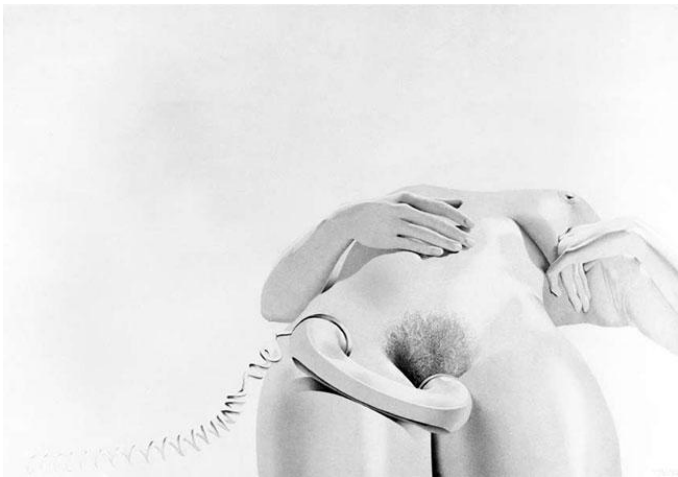
Figura 3. Uno de esos días (papel Canson sobre grafito). Fuente: www.larrocaoscar.com

La decisión de Elizalde entró rápidamente en conflicto con el mismo gobierno nacional, y el lunes 11 se iniciaron conversaciones entre autoridades municipales y del Ministerio de Educación y Cultura (MEC). Esas conversaciones culminaron el miércoles 13 en el edificio de la Presidencia de la República, donde se reunieron el presidente interino, Enrique Tarigo, la ministra de Educación y Cultura, Adela Reta, y el propio inten-