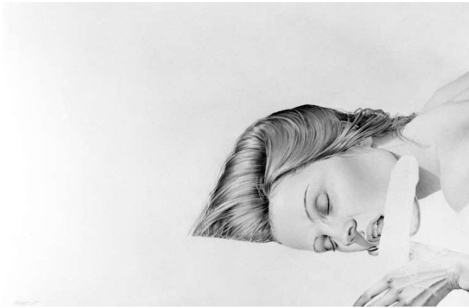
Figura 2. La cena (papel Canson sobre grafito).