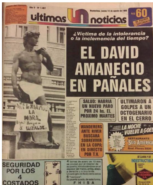
Figura 4. Portada de Últimas Noticias

En su página interior, junto al resto de las noticias sobre la renuncia de Espínola Gómez y la declaración del SUAP, solamente una pequeña crónica titulada «Strip-tease del David» (1986) describe la intervención. Es significativa la diferencia entre el tamaño de la foto de portada y la extensión mínima de la crónica. La sorpresa del cronista, y seguramente de los responsables editoriales de Últimas Noticias frente a la intervención visual, no habilitaba a una reflexión sencilla, lo cual se transmitía no solo en pocas palabras sino en una escasa claridad: