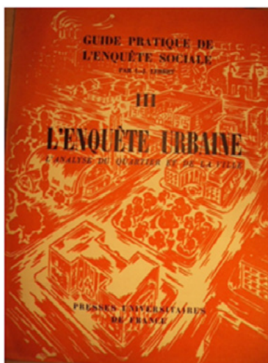
Figura 4. Reprodução da capa do Guide Pratique de L'Enquête Sociale – Parte III – L'Enquête Urbaine: L'Analyse d Quartier et de la Ville, lançado em 1955.

Assim, no início dos anos 1950 abre-se espaço dentro do Movimento para se falar em aménagement du territoire , terminologia que, conforme já apontamos no capítulo anterior, pode ser traduzida como ordenação do território, sendo empregada nos trabalhos desenvolvidos no campo do urbanismo na França, inclusive por Bardet. A expressão é traduzida por Lebret 55 como o aprimoramento da terra a partir dos aspectos de ordenação e melhoria das condições do solo, do subsolo e da energia, necessários para o desenvolvimento humano, o que Bardet chamava de topografia social.