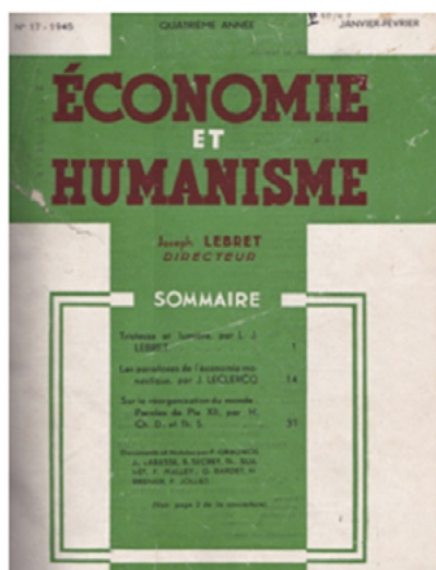
Figura 1. Reprodução da capa da Revue Économie et Humanisme , edição nº 17, lançada em 1945.

constituiu, para Pelletier e Puel, uma virada política um tanto modesta, porém um tormento teórico capaz de municiar a intelectualidade francesa contrária ao regime de Vichy.