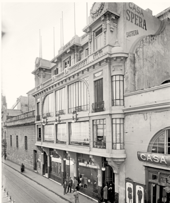
Imagen 1. La Casa Spera, calle Sarandí entre Treinta y Tres e Ituzaingó. Año 1919.