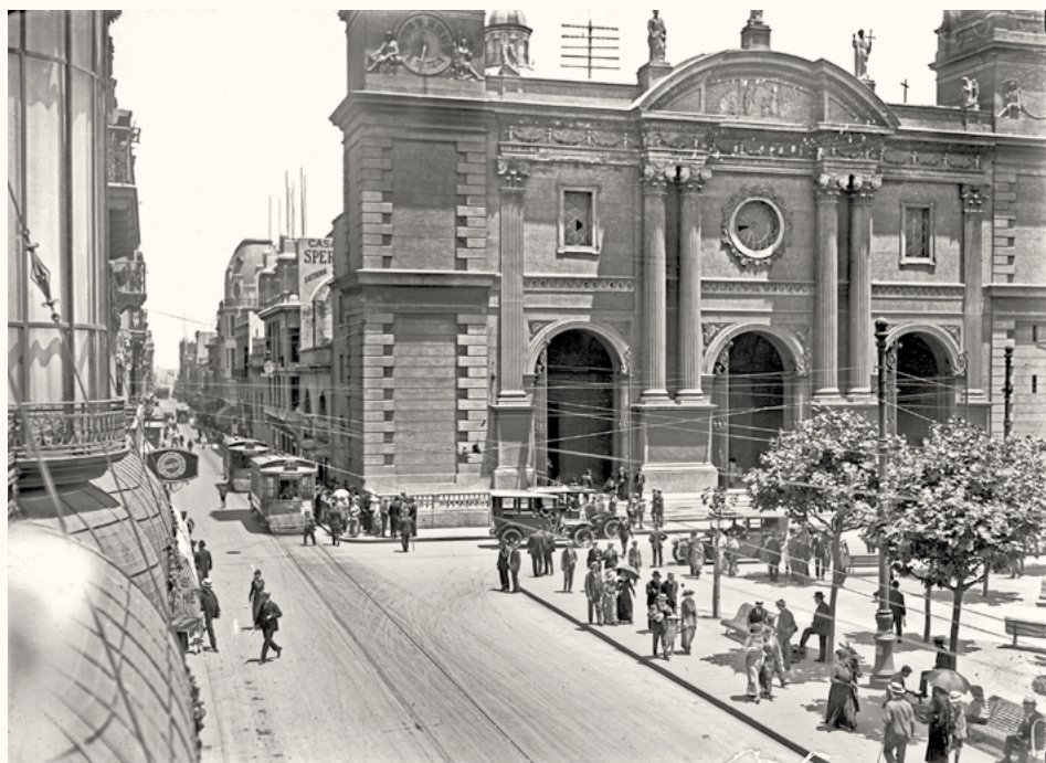
Imagen 3. Cruce de las calles Sarandí e Ituzaingó. A la derecha, la fachada de la Catedral y al fondo, por Sarandí, la Casa Spera. Año 1916. 00603FMHGE-CDF.

desde el siglo XVI hasta mediados del siglo XIX: es el Renacimiento; pero este estilo se caracteriza por cuatro períodos [...]. El primero es el estilo plateresco; luego el clásico puro; después el churrigueresco y finalmente el neoclásico. La iglesia de la Catedral representa el último, el neoclásico, que fue una vuelta al clasicismo de las líneas, y que fue el mejor, según la opinión de las más altas autoridades de la historia del arte. [La Catedral de Montevideo] representa el último momento de ese estilo del renacimiento español y es superior a todas las iglesias de América [...] porque todas esas construcciones representan momentos anteriores.