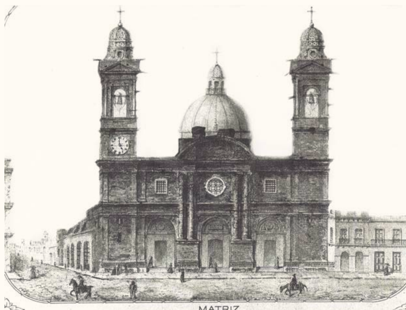
Imagen 2. La iglesia Matriz según grabado basado en uno de los daguerrotipos tomados por el abate Louis Compte el 29 de febrero de 1840, en el que son visibles «los cuartos» de la fachada sur.

Sus torres son bajas en relación al cuerpo central [...] las cúpulas que coronan las torres son de un estilo barroco que desentona completamente con el tímpano triangular de las mismas torres, que son de estilo griego, y esto a su vez desentona con los tímpanos de la parte central de la fachada que son estilo miguelangelesco. [...] Hay también en el frente ese desconcierto de líneas y de estilos que hay en las distintas presencias artísticas de la cúpula y de los tímpanos: ahora tenemos además las pilastras y las columnas de un estilo corintio, que vienen a formar un conjunto más híbrido, como fue híbrido todo el arte del siglo XVIII [...] donde el espíritu académico influyó poderosamente con sus dogmas ridículos, su frialdad y su ciencia pedantesca.